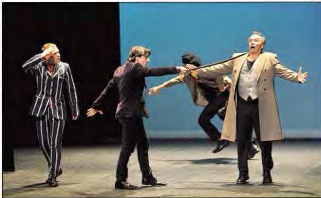
CRÉATION. La compagnie les Géotrupes était en résidence à Clermont-Ferrand et Beaumont en vue de ces Fourberies de Scapin , coproduite par la Comédie de Clermont.

Tout cela est vite balayé par un air de Daft Punk sur lequel se sont trémoussés, pour le final, les comédiens et une belle centaine de spectateurs... On vous a dit que c'était